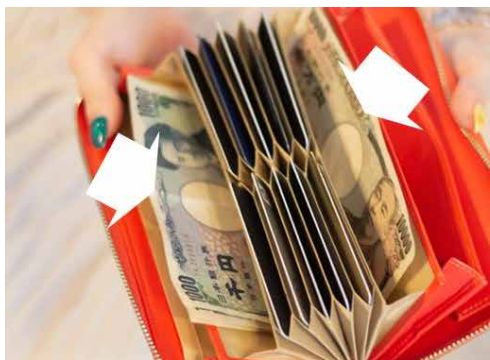
お札の種類も仕分けできます