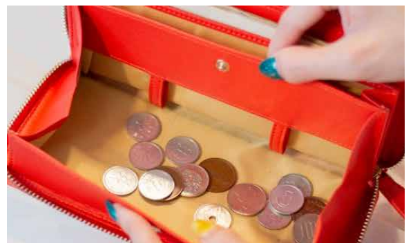
見やすくサッと取り出せます