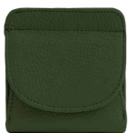
フォレストグリーン