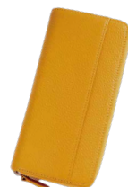
ゴールデンイエロー