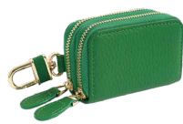
フォレストグリーン