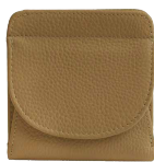
シャンパンベージュ