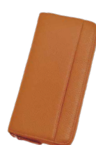
ブライトオレンジ